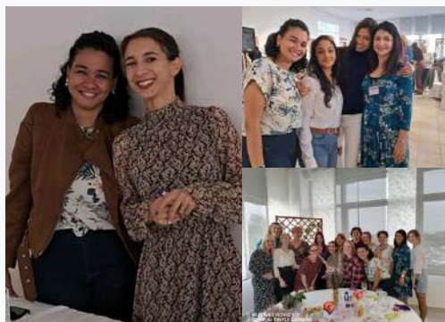
Café para Mulheres

Período do louvor no congresso do movimento estudantil (STEP). Foi o primeiro congresso do movimento realizado na capital do país. Um dos maiores centros estudantis da croácia está em Zagreb.