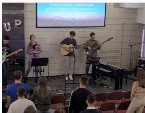
Congresso de Jovens - movimento estudantil em Zagreb

Momento da pregação por um pastor ucraniano. Ele e sua família estão refugiados aqui após o início da guerra.