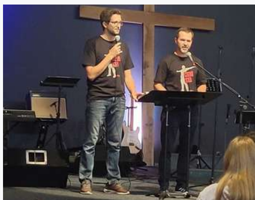
Congresso de Jovens na em Mačkovec

Nesse mês comecei minhas aulas de croata na escola de línguas estrangeiras da cidade. Além disso e das atividades de costume na igreja local, pude participar de dois congressos para jovens universitários. Um na Igreja Batista de Mačkovec e outro na Igreja Batista de Zagreb, na capital. Ser um jovem protestante nas universidades aqui é um desafio, então os movimentos estudantis começaram a fazer congressos na véspera do ano letivo universitário, que começa na primeira semana de outubro. São momentos preciosos para entender mais da cabeça desses jovens, seus pensamentos e incertezas.