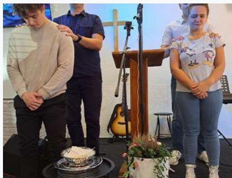
Batismo de novos convertidos

As mulheres da igreja de Varaždin preparam periodicamente um café com mulheres da cidade. Com uma palestra que seja válida para todos, mas que a mensagem conduza a Cristo. Pude auxiliar na música e recepção do evento.